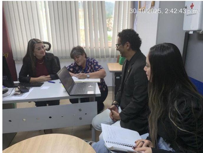
Fuente: Construcción propia: foto tomada el día 30/10/2025 asistencia a la reunión