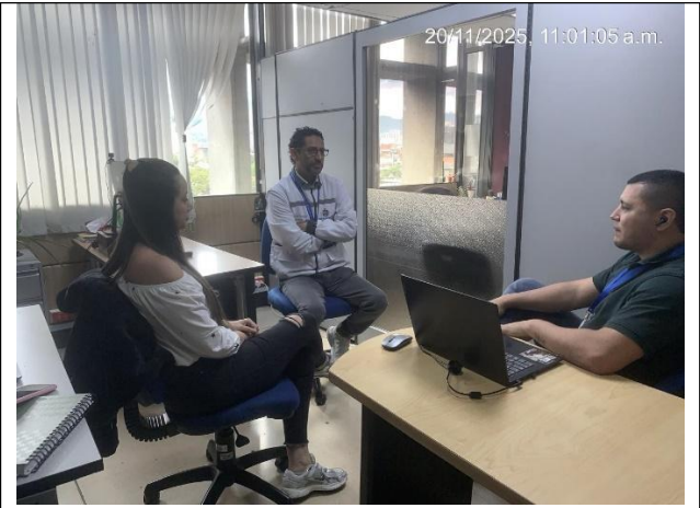
Mesa de Instalación de auditoría Planeación, comunicaciones y tecnologías de la Información