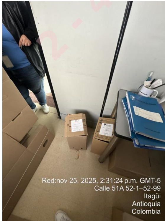
Red: nov 25, 2025, 2:31:24 p.m. GMT-5 Calle 51A 52-1-52-99 Itagüí Antioquia Colombia