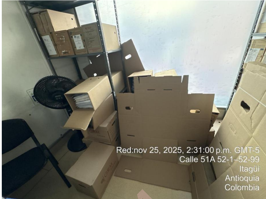
Red: nov 25, 2025, 2:31:00 p.m. GMT-5 Calle 51A 52-1-52-99 Itagüí Antioquia Colombia